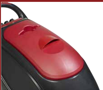
A robusztus konstrukció a megbízhatóság mellett hosszabb élettartamot eredményez