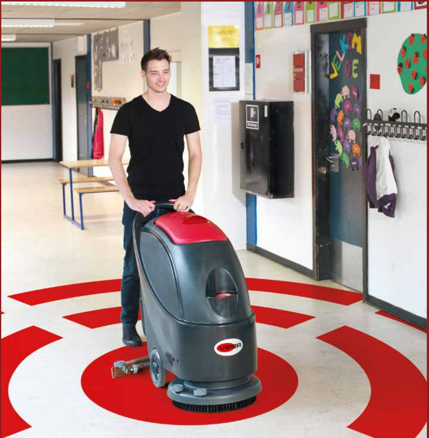
Tökéletes megoldás a nagy forgalmú helyek tisztán tartására