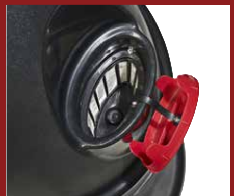
A vízbemenet szűrője megakadályozza, hogy szennyeződés jusson az víztartályba