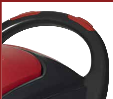
Az egyszerű és biztonságos használat érdekében a tartály robusztus fogantyúval és biztonsági kapcsolókkal van ellátva